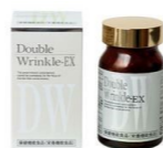
プラセンタ製剤 ダブルリンクLEX

細胞の生まれ変わりがちゃんと出来なかった場合には、アポトーシス(不要な細胞の自然死)を促す働きがあります。