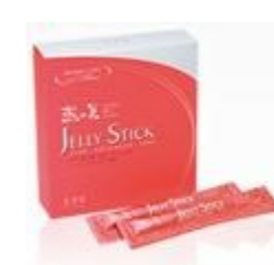
ツバメの巣ゼリースティック