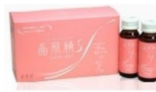
しょうきせい 晶肌精ドリンク