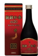
発酵紅参スーパーコンク