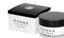
オゾナジェルクリーム